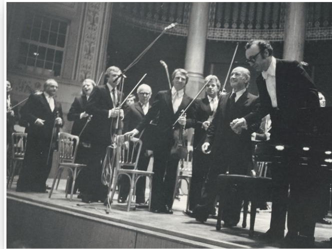
Som konsertmester i Wiener symfonikerne, med solist Alfred Brendel på slutten av 70-tallet.