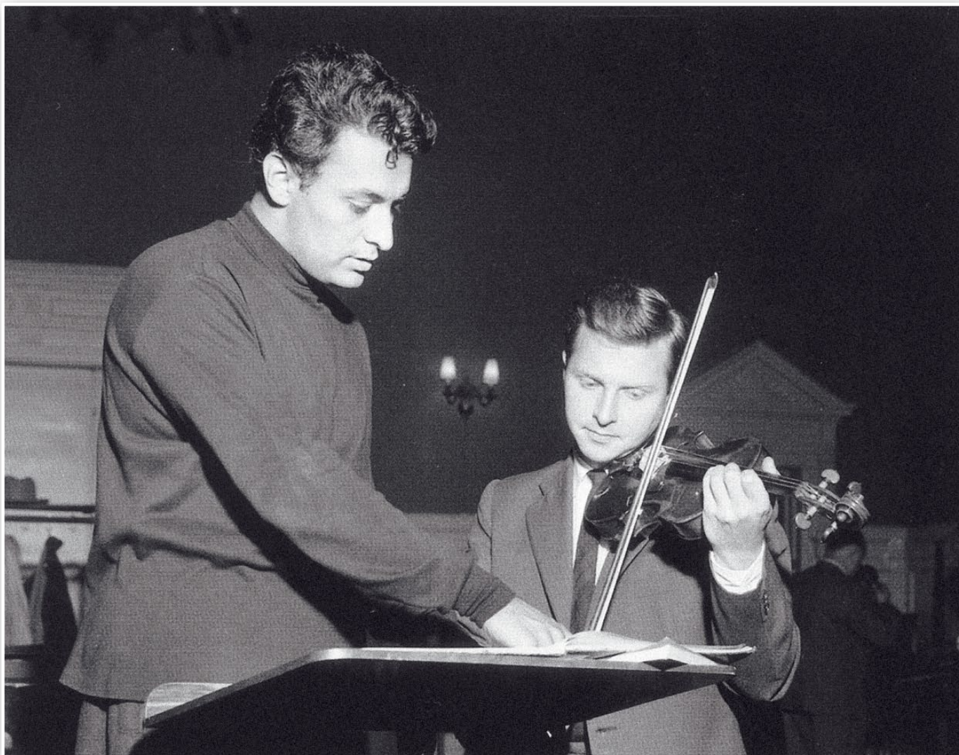
Zubin Mehta og Arve Tellefsen med Trondheim Symfoniorkester i 1960.