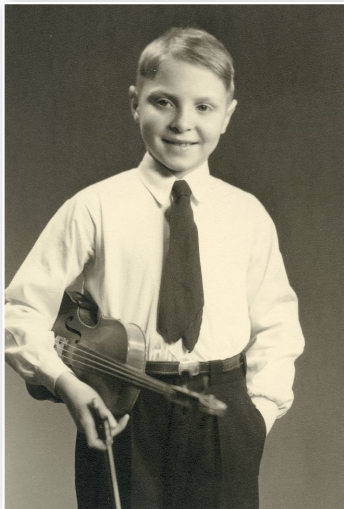
10 år gammel, i finstasen.