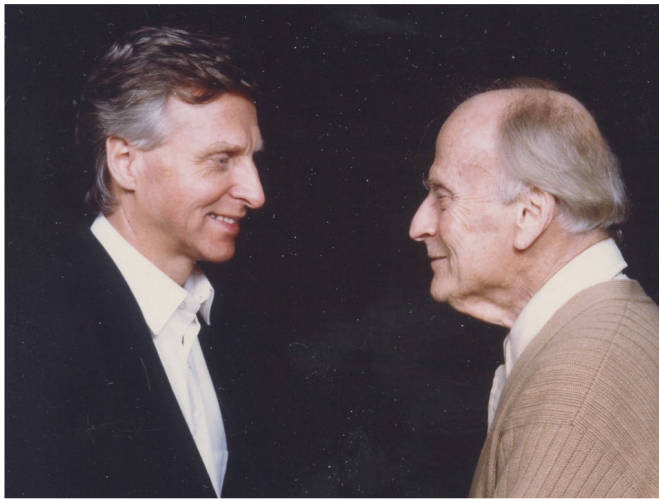
Arve Tellefsen og Yehudi Menuhin i forbindelse med innspillingen av Carl Nielsens fiolinkonsert, 1988.