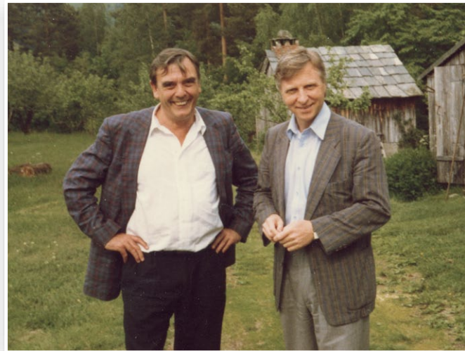
Venner gjennom mange år og et utall konserter: Kaare Ørnung og Arve Tellefsen.