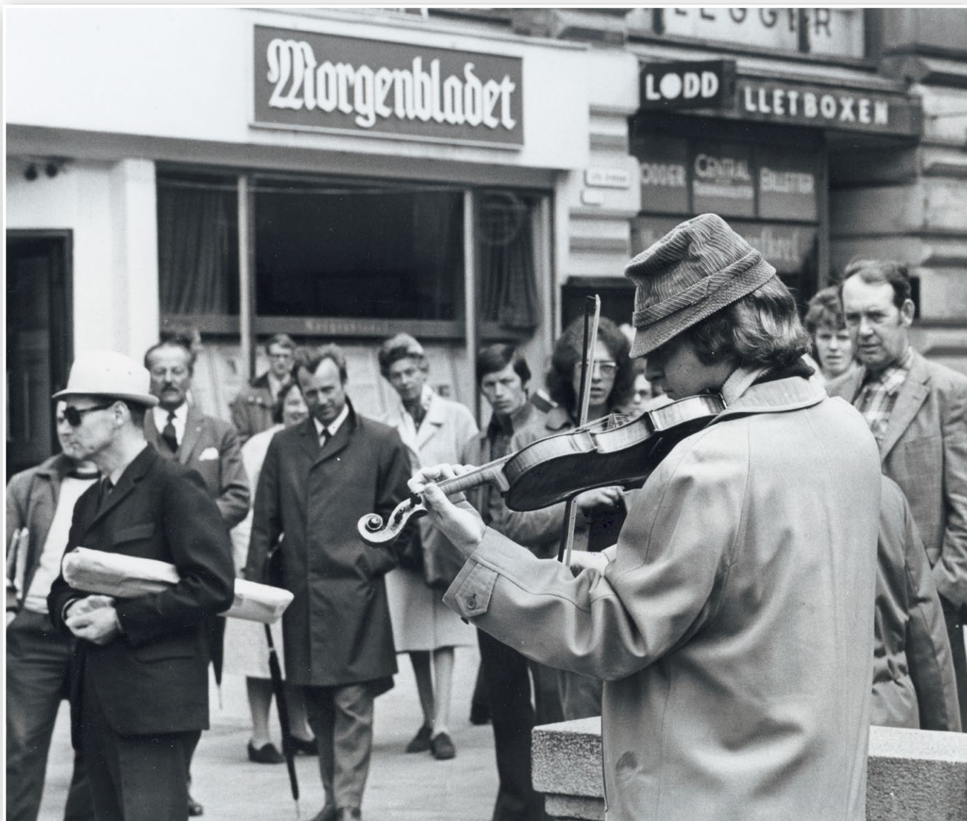
Forkledd som gatemusikant i Karl Johans gate for Billedbladet NÅ, 1977.