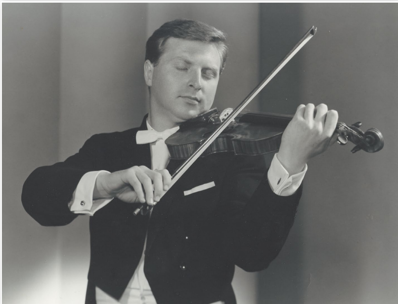
På 60-tallet skulle Arve Tellefsen oppleve å nå frem til publikum over hele landet.