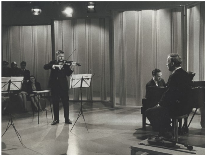
Fra BBCs TV-serie 'MasterClass' med Yehudi Menuhin, 1966.