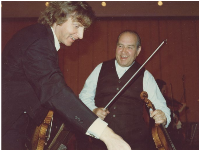
David Oistrakh var en viktig inspirasjonskilde, her fra et møte i Stockholm.