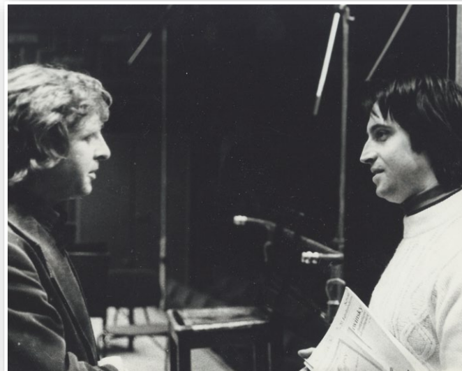
I samtale med Ricardo Muti etter prøve med Sveriges Radios Symfoniorkester.