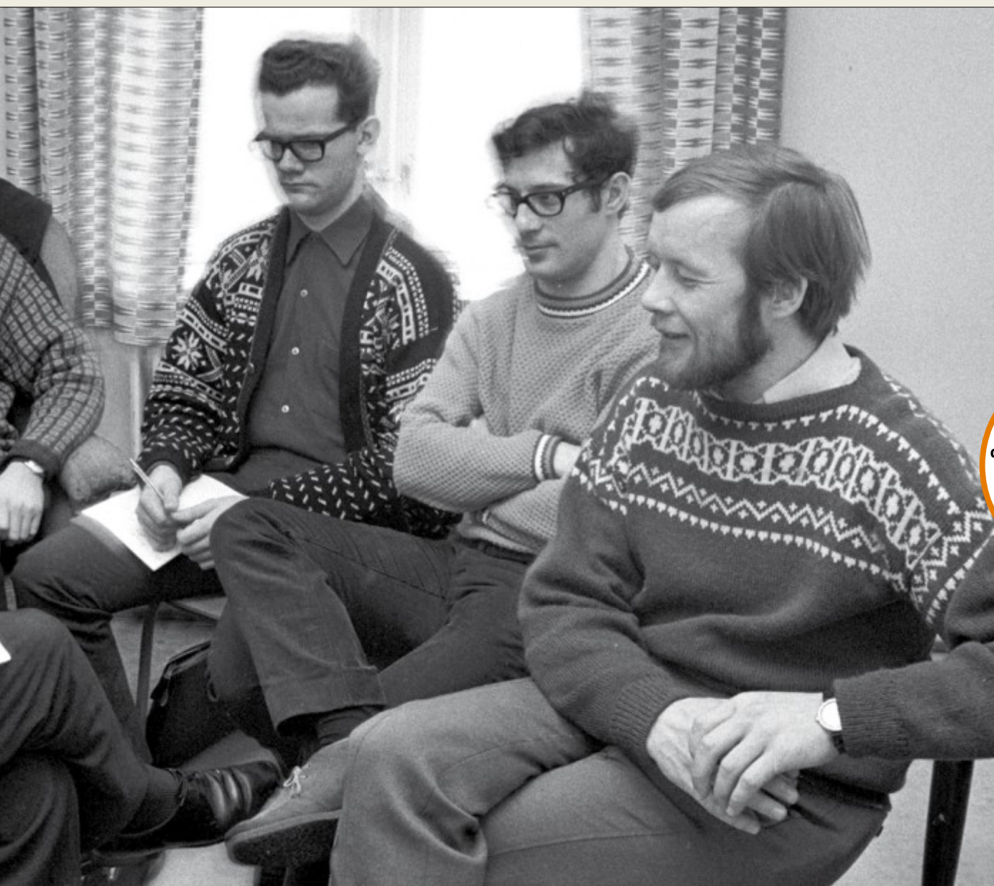
europaisk høymodernisme i Norge. Her leder han et kurs på Musikkonservatoriet i 1970.